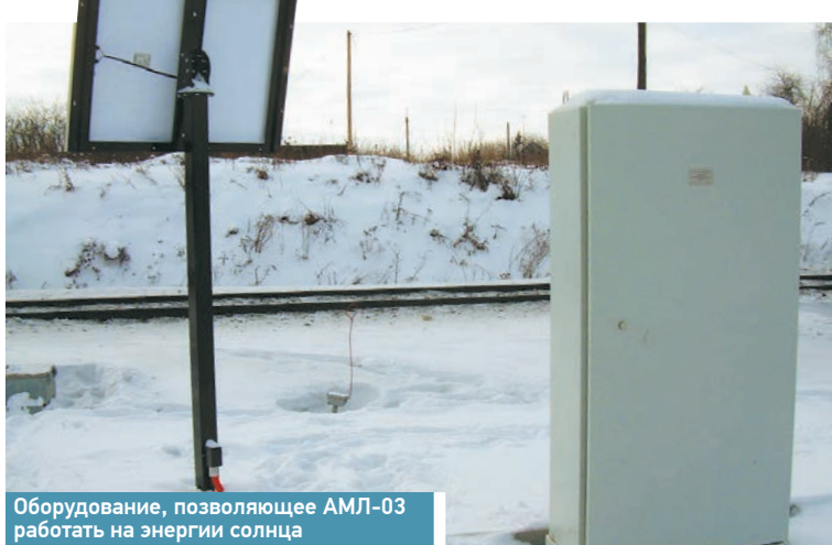
Оборудование, позволяющее АМЛ-03 работать на энергии солнца

В соответствии с инвестиционной программой ОАО «РЖД», в рамках внедрения прогрессивных ресурсосберегающих технологий на полигоне Рязанской дистанции пути впервые внедрён лубрикатор нового поколения – стационарный рельсосмазывать АМЛ-03 – производства ООО ЭМЗ «Машиностроитель». Такой агрегат позволяет в 1,5 раза сократить износ самого дорогостоящего элемента конструкции верхнего строения пути – рельса.