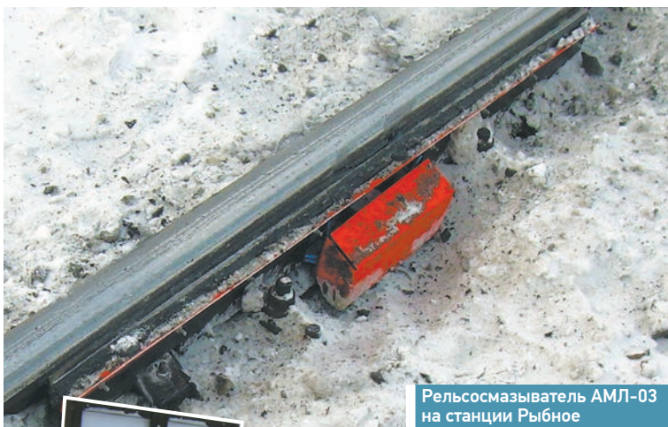
Рельсосмазывать АМЛ-03 на станции Рыбное