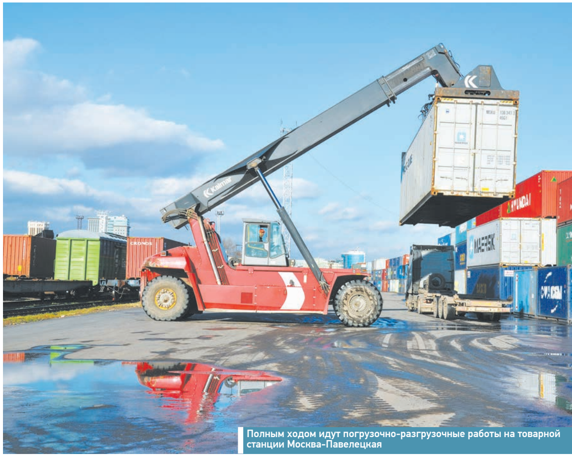
Полным ходом идут погрузочно-разгрузочные работы на товарной станции Москва-Павелецкая

Далее, на основании решений Комитета по приоритетным инвестиционным проектам совета директоров ОАО «РЖД» Московской дирекцией по управлению терминально-складским комплексом